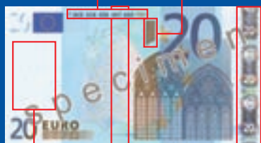
Arquitectura gótica 133 mm x 72 mm azul